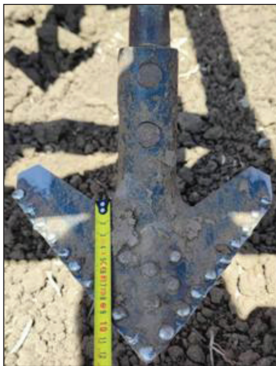
Рисунок 4. Общий вид стрелчатых лап блочно-модульного культиватора КПСОУ-8 с наработкой свыше 540 га: а) упрочненная стрелчатая лапа; б) серийная стрелчатая лапа.

Решался данный технический результат за счет того, что в предлагаемом способе упрочнения стрелчатой лапы осуществлялось прерывистое нанесение твёрдого износостойкого сплава наплавкой на поверхность основания рабочей части стрелчатой лапы с ограничением зон наплавки. При этом твёрдый износостойкий материал наносился в зонах наплавки рабочей части стрелчатой лапы в виде вплавленных в её ма-