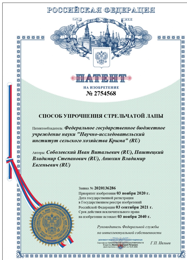
Рисунок 3. Патент на способ упрочнения стрелчатой лапы.

рами; n – толщина основы стрелчатой лапы.