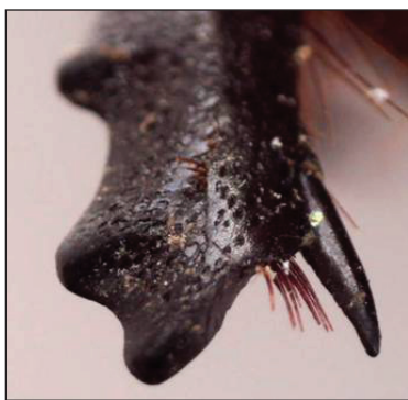
Рисунок 1. Общий вид роющей конечности жука-носорога под электронным микроскопом.

На базе отдела механизации производства и разработки новых образцов техники Федерального государственного бюджетного учреждения науки «Научно-исследовательский институт сельского хозяйства Крыма» разработан перспективный способ упрочнения стрелчатой лапы для рабочих органов почвообрабатывающих машин. Данный способ основан на исследованиях в области земледельческой биомеханики, которые дают возможность аппроксимировать элементы строения роющих конечностей жука-носорога (рисунок 1), обладающих повышенной надёжностью, на стрелчатые лапы рабочих органов почвообрабатывающих машин.