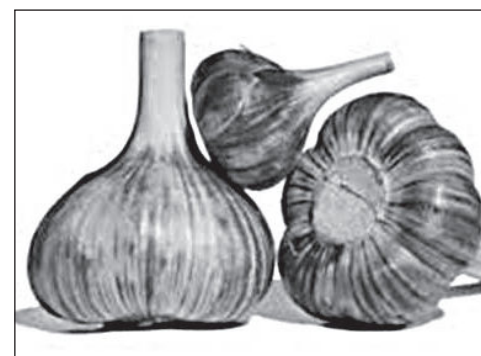
Сорт чеснока Любаша.

Нередки случаи, когда при перенесении нестрелкующихся форм из одних условий в другие они становятся стрелкующимися, и наоборот, стрелкующиеся – нестрелкующимися. Такое явление связано с изменением температурных и световых условий новой зоны выращивания. Для успешного выращивания чеснока нерайонированных сортов необходимо всестороннее их исследование. Первоначально нужно изучить природные свойства растения по отношению к теплу, световым и водным условиям роста. Для этого требуется провести детальные наблюдения за растениями при подзимней и весенней посадках с различными сроками посадки.