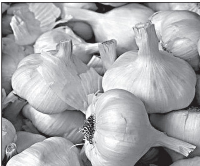
Сорт чеснока Добрыня.

Среди овощных культур чеснок по праву занимает ведущее место благодаря специфическому вкусу и остроте, большой фитонцидной активности, использованию в фармацевтической и перерабатывающей промышленности, способности к длительному хранению в свежем виде.