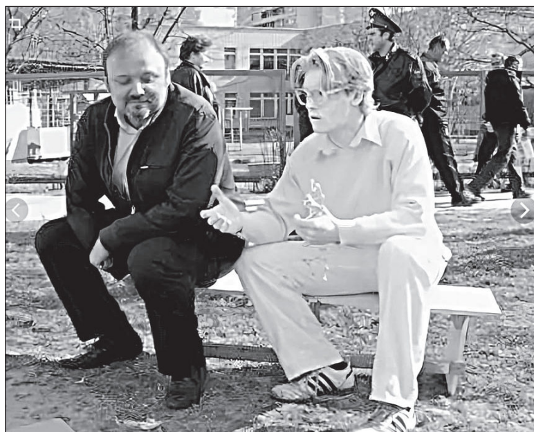
Человек в белом и в очках «живой МНС», присутствующий на открытии памятника.

Памятник, посвященный ученым, а именно – младшим научным сотрудникам, представляет собой уникальную скульптурную композицию, посвященную молодым кадрам научных тылов. Идея