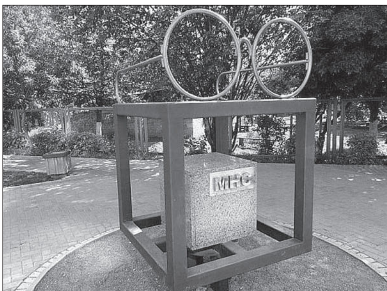
Памятник младшему научному сотруднику.

Научно-исследовательская деятельность – это «уникальный по своим характеристикам процесс, отличающийся от любого другого трудового процесса, поскольку он предполагает высокую регламентированную интенсивность мыслительного процесса научного работника, высокий уровень его аналитических умений, наличие способностей к поиску научных истин».