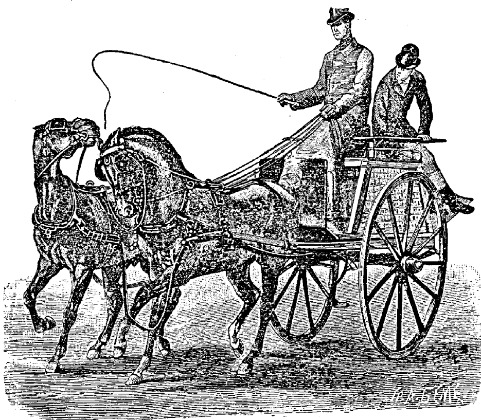
Рис. 459. Неправильная ѣзда „тандемъ“.

ѣздокъ становится позади лошади и, управляя вожжами, заставляет ее идти прямо, останавливаться, сворачивать, дѣлать повороты и проч. Лошадь при этомъ не должна тащить за собой человѣка, но идти настолько просторнымъ шагомъ, чтобы связь между ея ртомъ и рукой человѣка ни на минуту не прекращалась. Большое преимущество этого упражненія заключается въ томъ, что лошадь приучается идти прямо, а человѣкъ еще до того, какъ сѣсть на козлы, научается управлять и останавливать, а также умѣть владѣть бичемъ. При этомъ человѣкъ долженъ слѣдить, чтобы лошадь дѣйствительно шла прямо, и при первомъ уклоненіи помочь бичемъ. Если лошадь выкажетъ желаніе бить задомъ, то