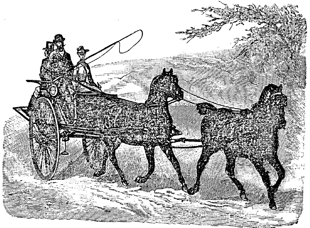
Рис. 424. Запряжка „тандемъ“ или гусемъ.

Перекрещивающіеся поводья слѣдуетъ застегивать такимъ образомъ, чтобы головы лошадей были совершенно прямо поставлены, иначе имъ неудобно тянуть. Очень практично оба эти повода пропускать черезъ сво-