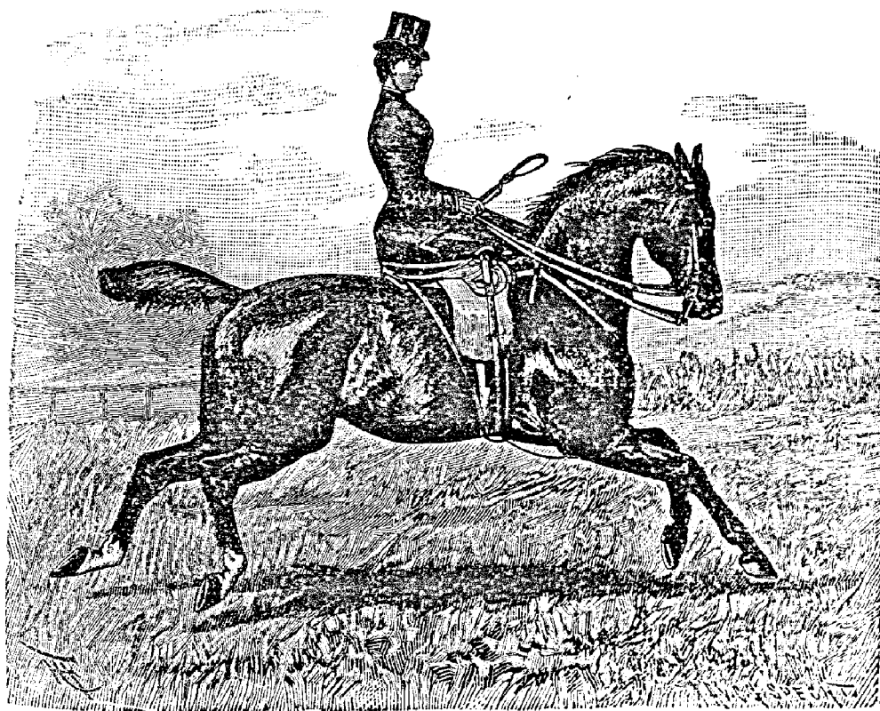
Рис. 322. Посадка амазонки на полевомъ галопѣ.

„Vieille Moustache“ въ интересномъ сочиненіи своемъ „The barb and the bridle“ совѣтуетъ дамамъ учиться подниматься въ сѣдлѣ на спокойно стоящей лошади сначала безъ помощи стремянъ. Тотъ же авторъ нахо-