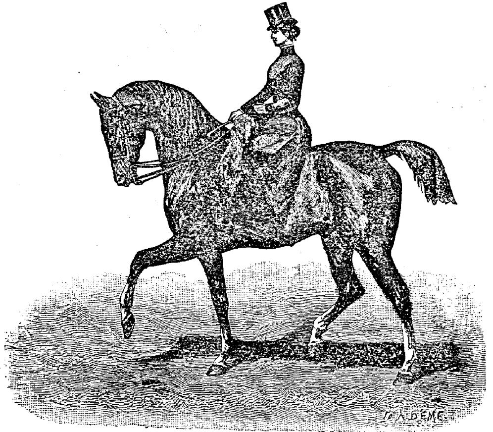
Рис. 319. Посадка амазонки на шагъ.

Между многими усовершенствованіями, съ цѣлью устранить возможность зацѣпиться за луку при паденіи амазонки, мы бы могли посовѣто-