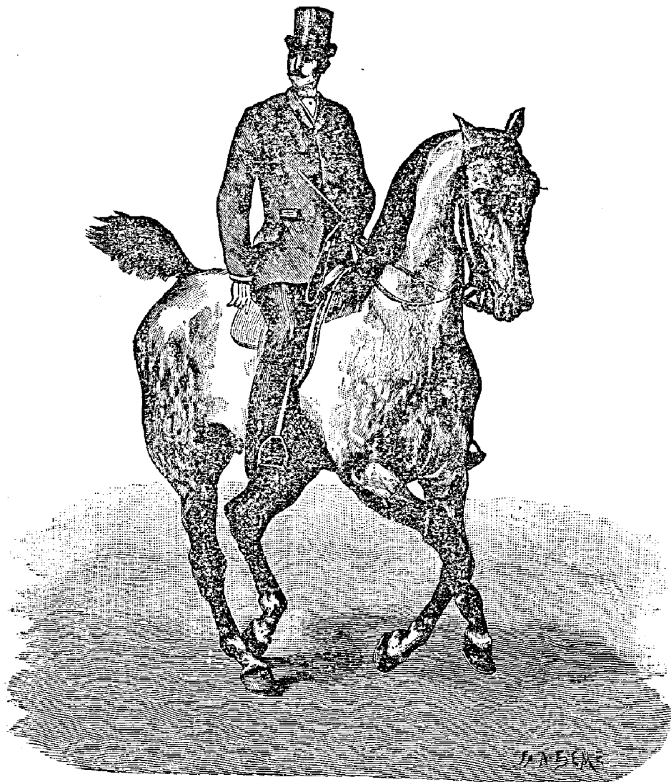
Рис. 333. Посадка на галопѣ.

Галопъ вѣренъ, если задняя и передняя ноги противоположной діагонали дѣйствуютъ одновременно. При галопѣ съ правой ноги лошадь должна, имѣя постановленіе (глазъ) направо, отталкиваясь лѣвой задней