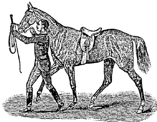
Рис. 298. Приготовленіе къ сгибанію по методѣ Дж. Филлиса.

Упражненія для ногъ. I. Держать колѣно близъ сѣдла, приподнимать выше икры и ступню одной ноги, а затѣмъ другой, не дотрагиваясь до лошади и не мѣняя положенія колѣнъ.