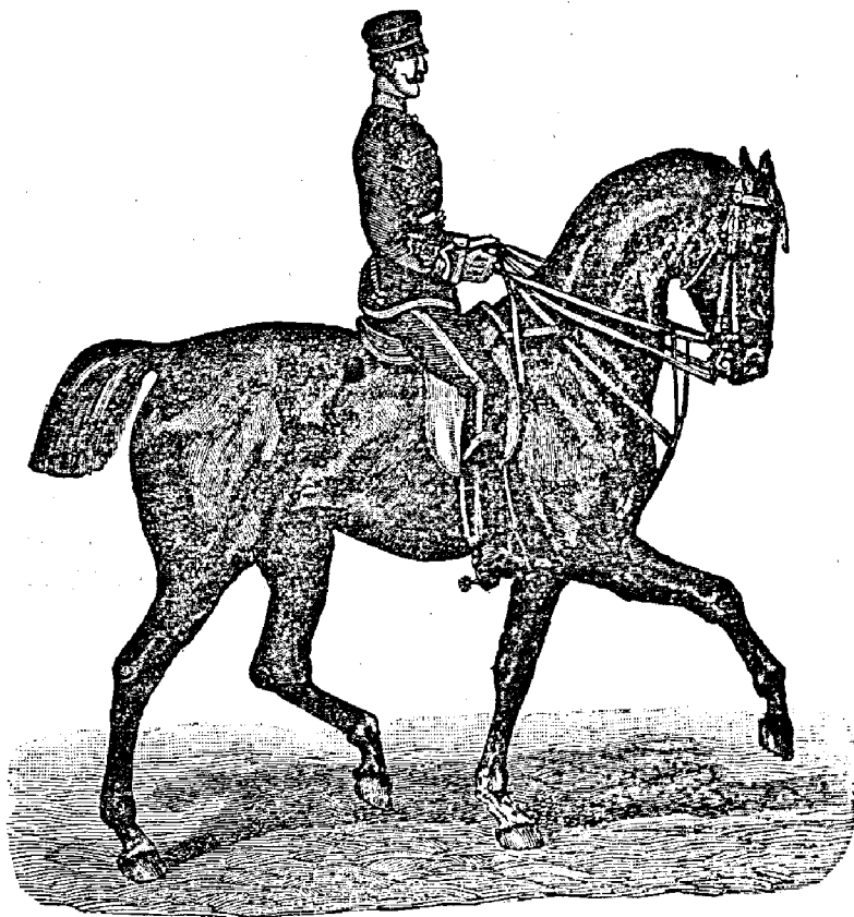
Рис. 297. Посадка ѣздока на шагъ (на рисунокъ этомъ, взятомъ изъ книги гр. Врангеля „Das Buch vom Pferde“ положеніе ноги всадника изображено неправильно, ее слѣдовало бы отнестн каблукѣмъ назадъ).

Упражненія для посадки. I. Опустить руки; вытянуть ляшки, затѣмъ привести ихъ въ прежнее положеніе; колѣни при этомъ сгибать во внутрь. Эти упражненія производить почаще. II. Приподнять оба колѣна, чтобы они сошлись поверхъ луки, и вновь ихъ привести въ прежнее положеніе. При этомъ надо стараться внутреннюю поверхность ляшекъ привести въ возможно большее соприкосновеніе съ сѣдломъ, держа все остальное тѣло неподвижно. III. Упирается ляшками на сѣдло и наклонять верхнюю часть тѣла назадъ до соприкосновенія плечъ съ крестцомъ. Приподниматься ме-