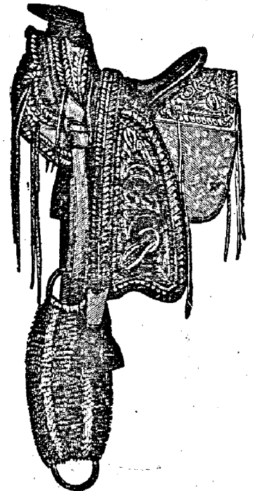
Рис. 233. Мексиканское національное сѣдло.

Цѣль всякаго взнуздыванія лошади — заставить ее наилучшимъ способомъ повиноваться волѣ всадника. Для достиженія этой цѣли необхо-