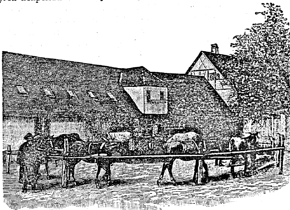
Рис. 207. Способъ работы лошадей. (Пасковскій тренировочный кругъ).

Странно, что люди, имѣющіе дѣло съ заѣздкой лошадей, не придерживаются одного и того же метода при первыхъ урокахъ. Одинъ рекомендуетъ запрячь молодую лошадь рядомъ съ другой, старой лошадыю; другой непременно совѣтуетъ запрячь лошадь въ четырехколесный оди-