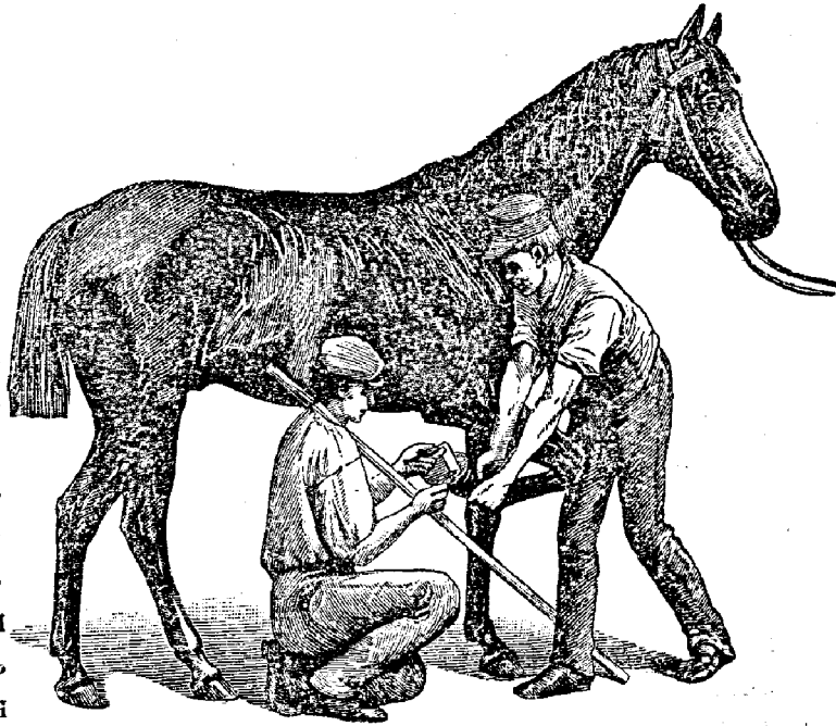
Рис. 96. Примѣненіе копытнаго ножа Состедта.

Какъ видно изъ рис. 94, лезвіе этого инструмента къ концу суживается и обоюдоостро, такъ что ножомъ, смотря по надобности, можно дѣйствовать вправо или влѣво. Нижняя часть ножа нѣсколько выпукла, вслѣдствіе чего лезвіе, описывающее при дѣйствіи кругъ, можетъ легко скользить по