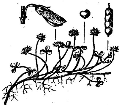
Рис. 17. Бѣлый клеверъ ( Trifolium repens ).

„Насколько вредно кормленіе въ большомъ количествѣ сухимъ сѣномъ лошадей, страдающихъ одышкой, настолько полезно кормленіе такихъ лошадей сильно смоченнымъ сѣномъ въ большомъ количествѣ. Насколько быстро въ первомъ случаѣ можно вызвать или увеличить одышку у лошадей, склонныхъ