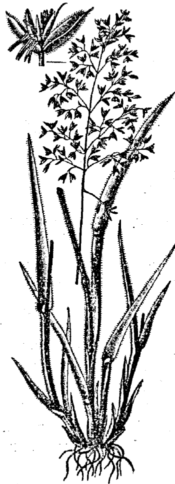
Рис. 16. Бухарыкъ пушистый ( Holcus lanatus ).