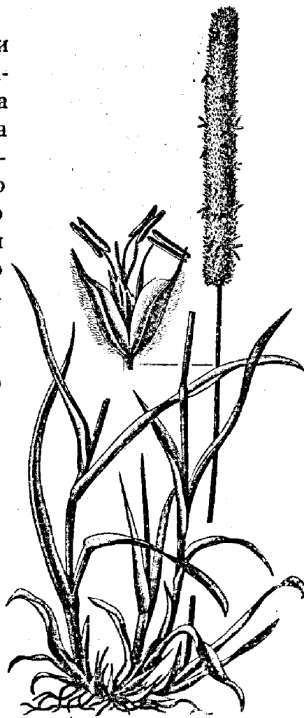
Рис. 12. Тимофеева трава ( Phleum pratense ).

Въ ноябрѣ обыкновенно сѣно уже настолько вылежалось, что можетъ быть скармливаемо безъ всякаго риска.