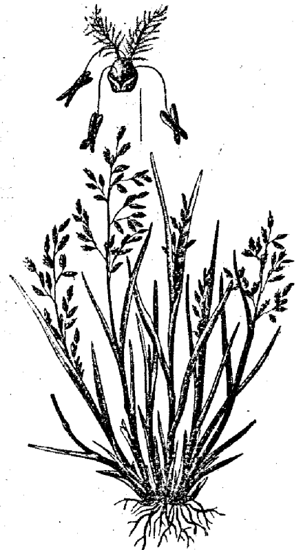
Рис. 15. Мятликъ ( Poa annua ).

Другое средство для сокращенія времени кормленія, это — смачиваніе сѣна; что этимъ средствомъ достигается цѣль, это не подлежитъ сомнѣ-