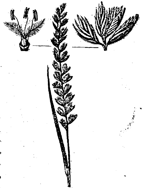
Рис. 11. Гребенникъ ( Cynosurus cristatus ).

Песокъ въ небольшомъ количествѣ особеннаго вреда не приноситъ; но если его много и такое сѣно скармливается продолжительное время, то песокъ этотъ, скопляясь въ толстой кишкѣ, образуетъ вмѣстѣ съ кормомъ, такъ называемые песочные камни, производящіе тяжелые запоры. Если же приходится по тѣмъ или другимъ причинамъ скармливать испорченное сѣно, то пыльное необходимо предварительно перетрусить, смочить свѣжей водой, выжать и сейчасъ же скармливать; заплѣсневѣлое — нужно просушить, перебить, и худшую часть совершенно отбросить, затѣмъ присыпать растворомъ поваренной соли и уже тогда задавать въ кормъ; лучше,