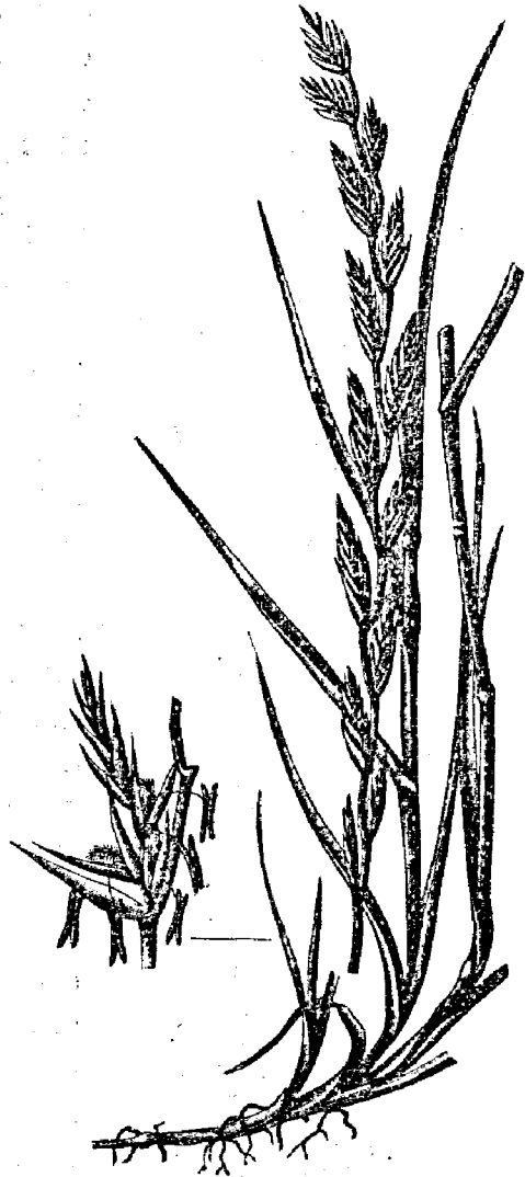
Рис. 8. Англійскій райграссъ ( Lolium perenne ).