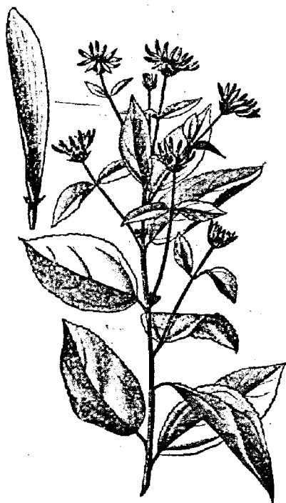
Рис. 7. Земляная груша ( Helianthus tuberosus ).

На западѣ Европы обыкновенно скармливаютъ земляную грушу въ сыромъ видѣ; причемъ въ количественномъ отношеніи дача ея, какъ подсобнаго корма, во всемъ сходна съ картофелемъ. Рабочія лошади тяжелаго типа при дачѣ имѣ 31 1 / 4 ф. земляной груши и 12 1 / 2 ф. овса чувствовали себя совершенно удовлетворительно. Скармливаніе же ея благороднымъ лошадямъ никогда не практиковалось даже на Западѣ и кажется тамъ столь же невѣроятнымъ, сколько невѣроятнымъ можетъ казаться въ Россіи употребленіе этого корма лошадямъ вообще.